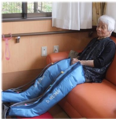
ドクターメドマー

空気力で血行促進するエアーマッサージで血行促進・むくみや足のだるさに効果があります。