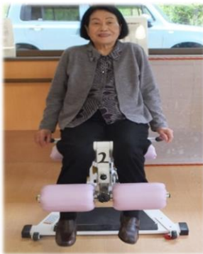
レッグエクステンション